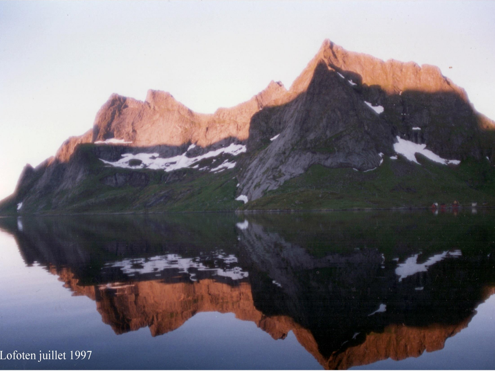
Lofoten juillet 1997